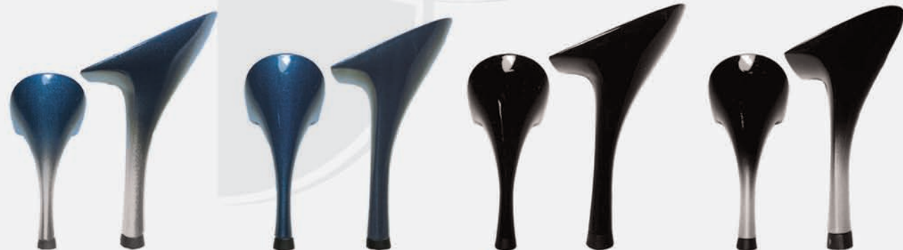
blu sfumato argento