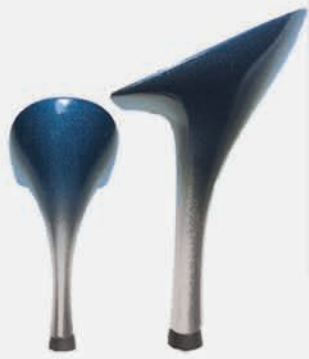
blu sfumato argento