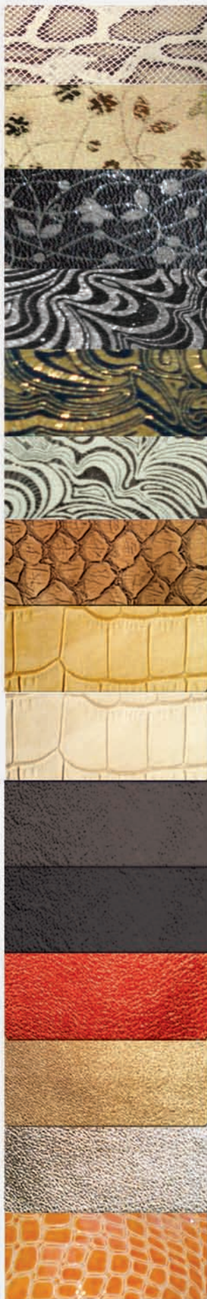
aconcagua white beach