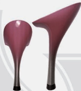
glicine sfumato argento