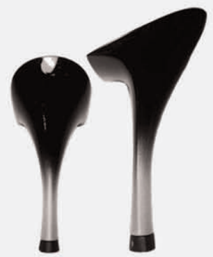
nero sfumato argento