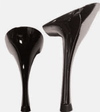
metallizzato canna di fucile