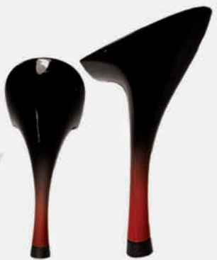
nero sfumato rosso